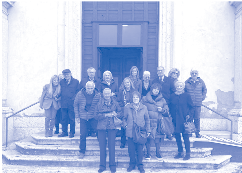
Chiesa di Santa Teresa degli Scalzi - foto di gruppo di Dal Corso