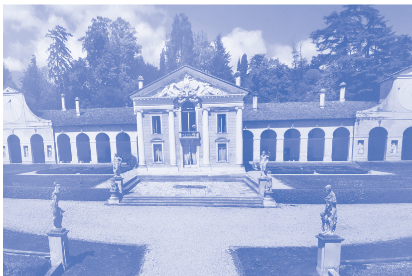
Villa Barbaro a Maser