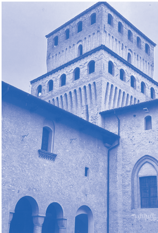
Castello di Torrechiara

gli Sforza. Pare che sia intervenuto personalmente a disegnarne la struttura. Anche perché quella fortezza, che rientrava nell'ambizioso progetto di ristrutturazione territoriale dei suoi possedimenti, estesi su circa un quinto del Parmense, doveva dimostrare il peso della famiglia nella zona.