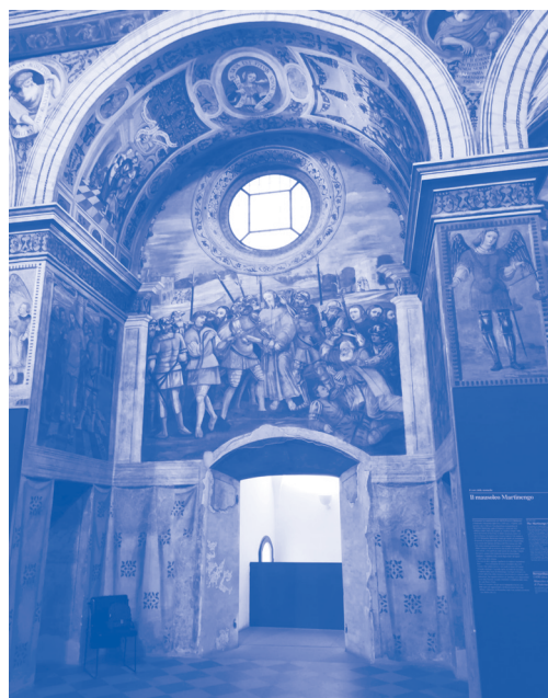
Mostra dei macchiaioli

Per tutta la durata della visita abbiamo osservato con ammirazione i numerosi quadri, sovente di piccole dimensioni, provenienti sia da collezioni private, che di solito non sono accessibili al pubblico, sia da importanti musei, come gli Uffizi di Firenze, e abbiamo ascoltato le puntuali spiegazioni di Sara che, dopo una pausa conviviale rificillatrice, ci ha accompagnato nel pomeriggio in un altro affascinante itinerario: il complesso museale di S. Giulia , che degnamente rappresenta il museo della città di Brescia e del suo territorio. Si trova lungo l'antico decumano massimo della Brixia romana all'interno del Monastero di S. Giulia , che venne eretto per volere del re dei Longobardi (757/774) Desiderio a onore della martire cristiana originaria di Cartagine. Il monastero femminile, che nel corso dei secoli fu ampliato e variamente modificato sopra tutto fra il XV e XVI secolo, come ci ha spiegato la guida, ebbe quale prima badessa Anselperga, una delle figlie di Desiderio e della regina Ansa ; proprio all'iniziativa della regina si deve non solo l'edificazione della chiesa di s. Salvatore nel 753 ma anche la traslazione a Brescia nel 762 delle reliquie di s. Giulia , provenienti dall'isola di Gorgona. Nella chiesa di s. Salvatore, che custodisce i reperti più importanti del dominio longobardo a Brescia, abbiamo potuto ammirare, fra l'altro, una