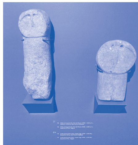
Reperti Archeologici

veronese ci hanno tramandato. Dall'arte Paleolitica dei primi Sapiens, lungo i millenni della storia umana, alla rivoluzione Neolitica con i primi vasi di coccio per cuocere e conservare il cibo, poi all'età del Bronzo fino all'età del Ferro, quando si intuiscono i primi contatti che queste popolazioni venete cominciano ad avere con gruppi provenienti da altre regioni come gli Etruschi e i Celti.