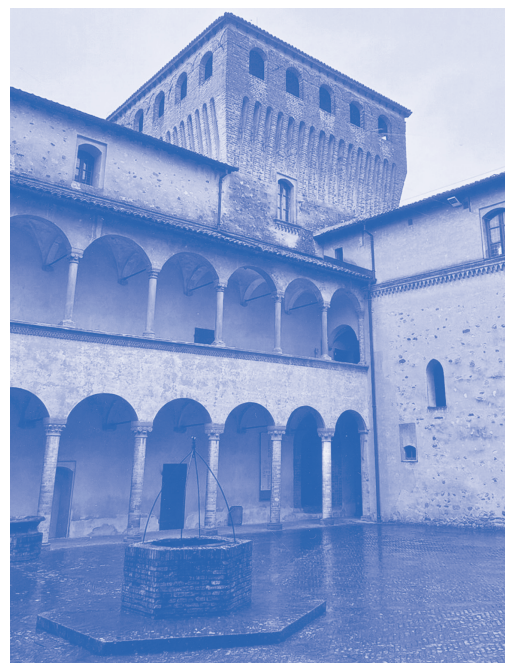
Castello di Torrechiara

Sabato 19 ottobre la Famiglia Marchigiana ha organizzato una visita al castello di Torrechiara nel comune di Langhirano, provincia di Parma . Sorge su una collina terrazzata che si eleva sulla sponda sinistra del torrente Parma che dà il nome alla valle. Torrechiara, il piccolo borgo che sta ai piedi della fortezza, in epoca medievale si chiamava Torcularia o Torclaria , poi Torchiera . Il nome lo deve alla presenza di numerosi torchi per la spremitura dell'olio, prodotto con i frutti degli oliveti che in passato si estendevano sulle colline circostanti. Il castello è una delle fortificazioni meglio conservate del territorio e più ricche di fascino. Fu costruito tra il 1448 e il 1460 sulle rovine di un precedente fortilizio, distrutto nel 1259, e di una casaforte - residenza signorile fortificata -, demolita nel 1313.